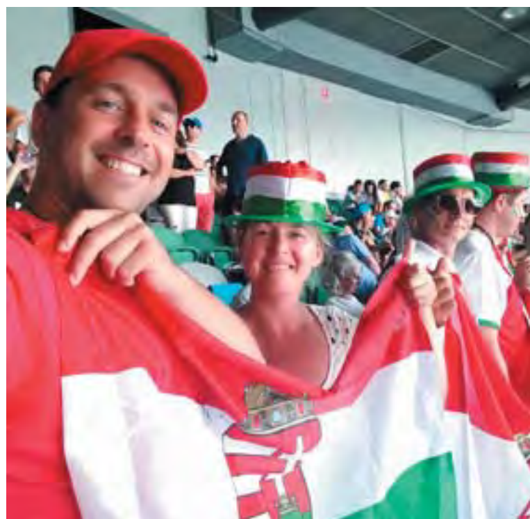
Szurkolás a Fucsovics-Federer meccsen