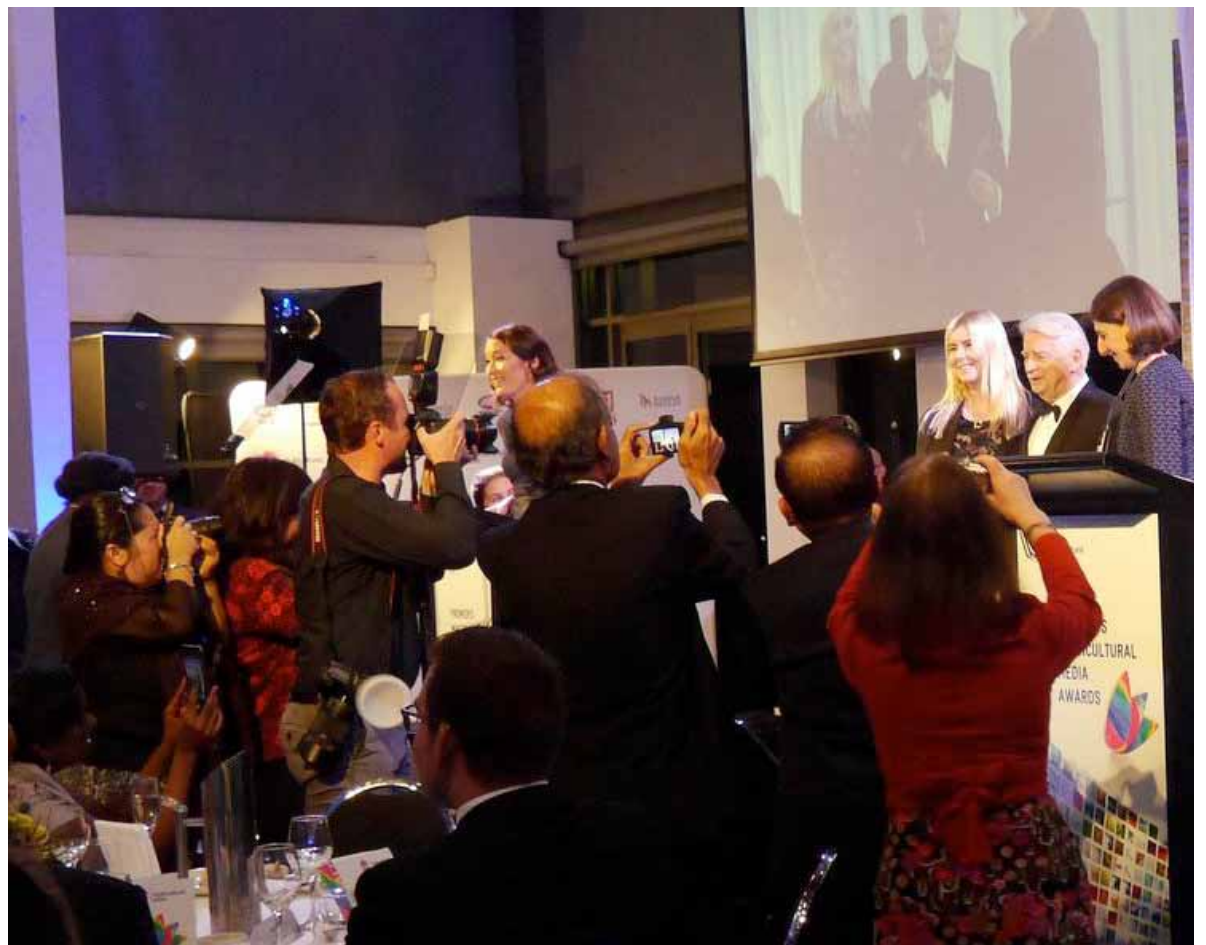
Minister for Multiculturalism Ray Williams MP