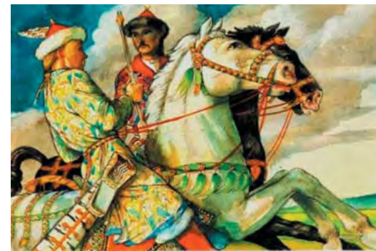
Honfoglalás korabeli magyar lovasok (László Gyula professzor rekonstrukciója)

A fényes győzelem azonban még nem jelentette a csata végét, hiszen a Duna északi partjára eközben beérkezett Luitpold örgróf érintetlen serege. Theotmár hadainak súlyos veresége azonban keresztülhúzta Luitpold eredeti számításait, hiszen a jobb parti hadak megsemmisülése miatt senki sem állhatta útját a magyarok átkelésének.