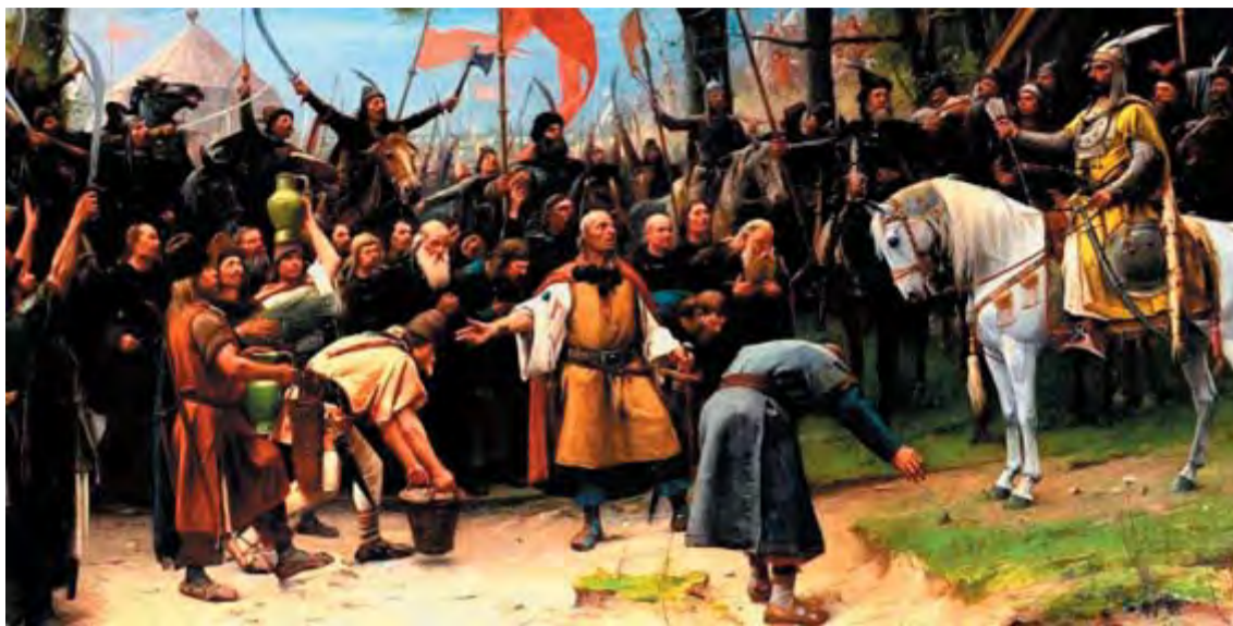
A honfoglalás Munkácsy Mihály festményén. A honfoglalást követő évtizedeket a kalandozások korának is hívják

non, aki helyett Hatto mainzi érsek gyakorolta ténylegesen a hatalmat. A magyarok másik nyugati szomszédja Luitpold örgróf Bajor Fejedelemsége volt.