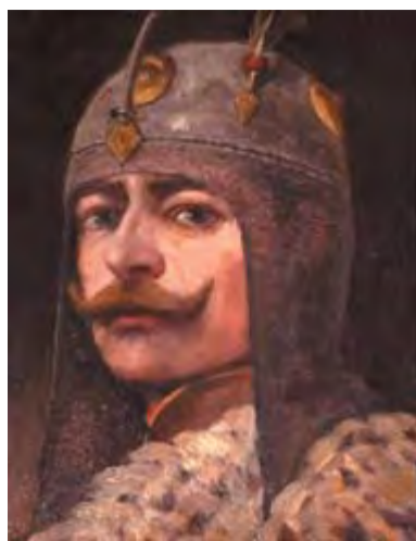
Árpád nagyfejedelem (Feszty Árpád portréja)

A történetírás sokáig nem a jelentőségéhez mérten kezelte az ezerszáztíz éve, 907. július 4-én a magyar törzsszövetség, valamint az egyesített keleti frank és bajor hadak között Pozsony mellett lezajlott csatát. Ez az ütközet, amelyet a Kárpát-medencében letelepedett magyarság első nagy honvédő háborújának is tekinthetünk, megszilárdította és véglegessé tette Árpád nagyfejedelem művét, a honfoglalást. A túlerővel szemben aratott fényes győzelem után több mint egy évszázadig, nem mertek idegen hadak a Kárpát-medence földjére lépni. Európa ekkor tanulta meg igazán félni a magyarok nyilait.