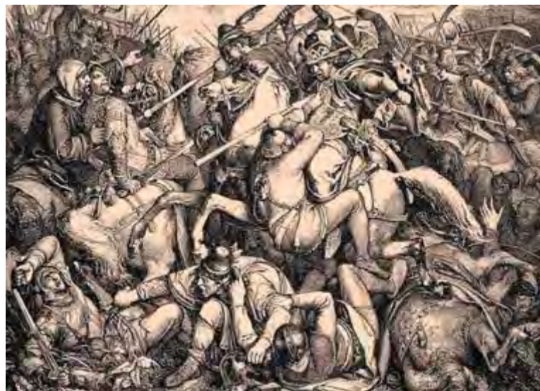
A pozsonyi csata egy 19. századi metszeten