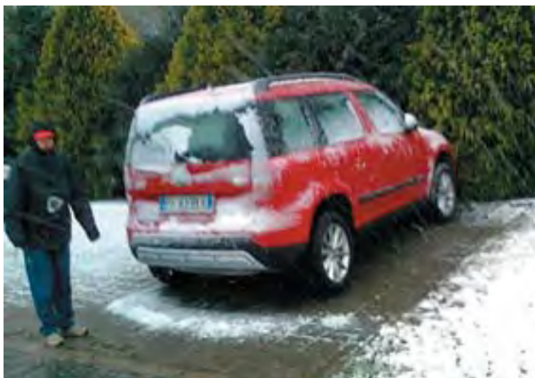
Tájkép: Magyarország 2017. április 17.