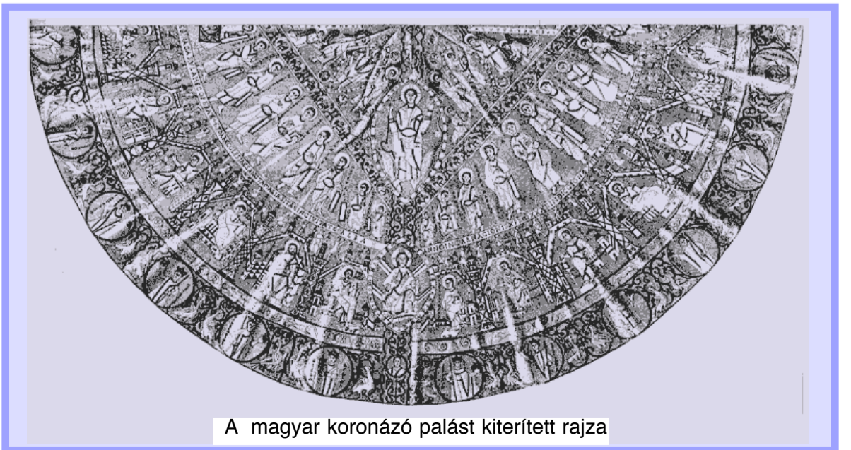
A magyar koronázó palást kiterített rajza