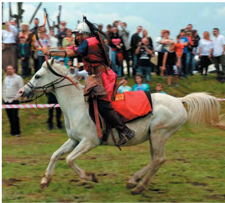
Korhú harci ruhába öltözött hagyományörző az Emlékhelyek napján rendezett, a muhi csatára emlékező bemutatón Muhiban