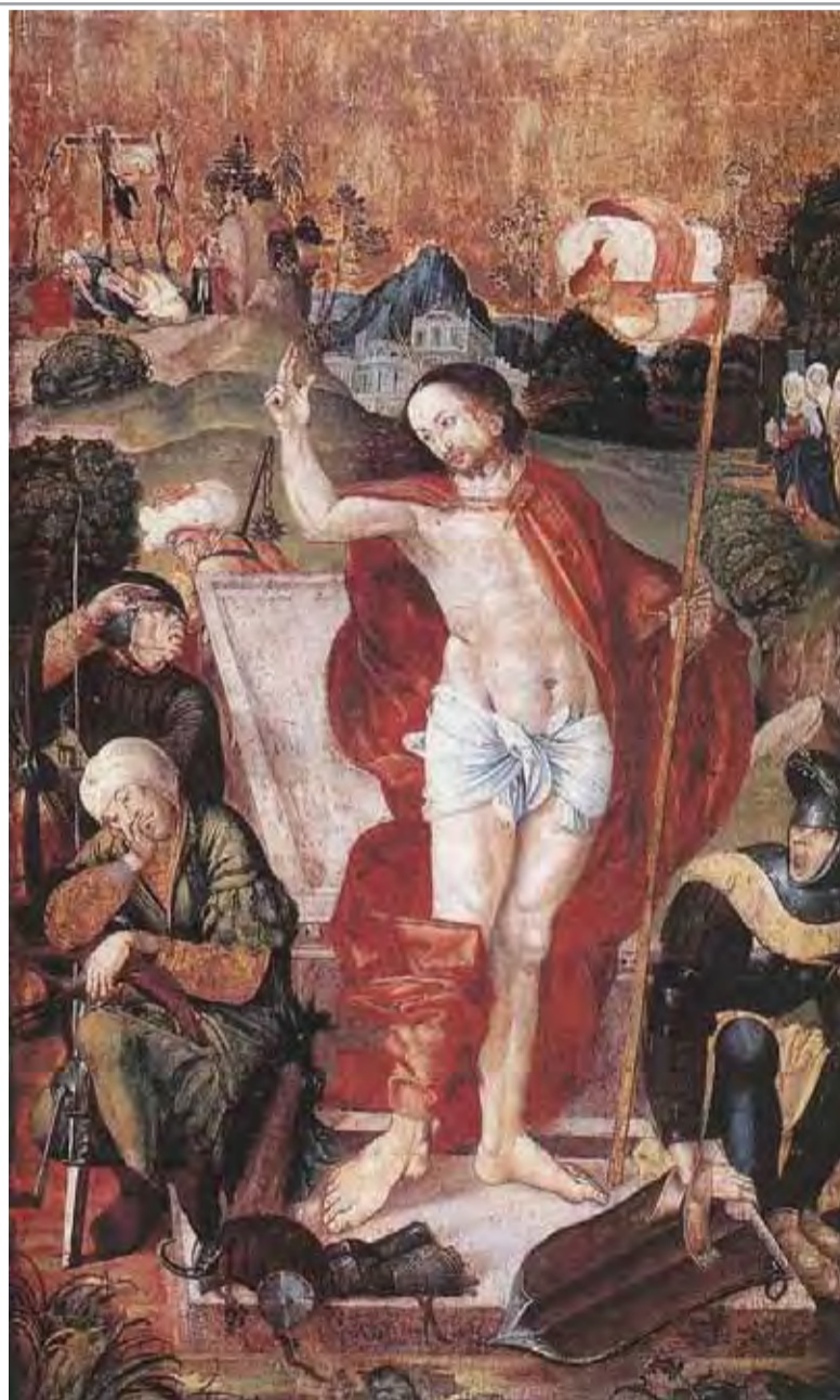
M. S. mester Resurrection (1500 május)