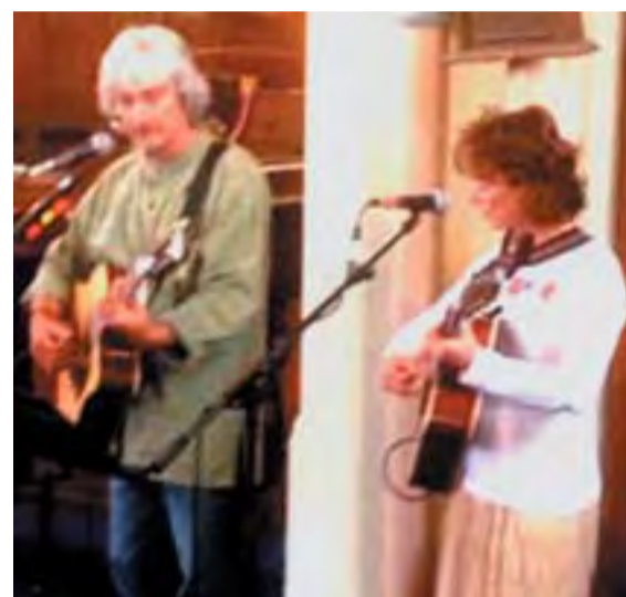
A Hangraforgó Együttes a vasárnapi Istentiszteleten

Minden hó első vasárnapján Presbiteri Gyűlés.