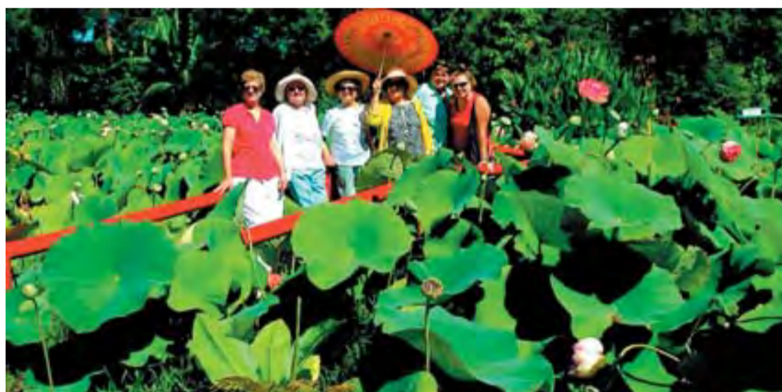
A hatalmas tavirózsák között