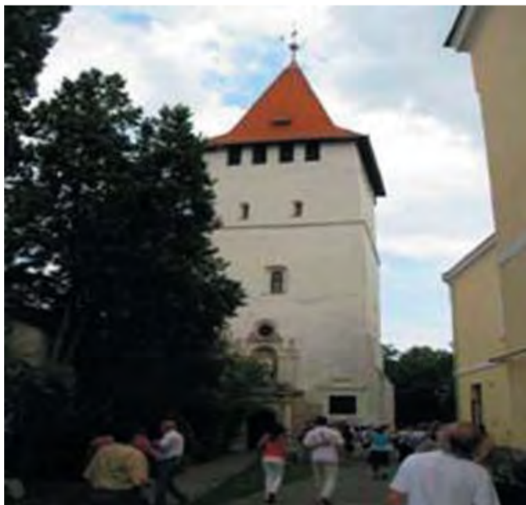
A Csonka torony