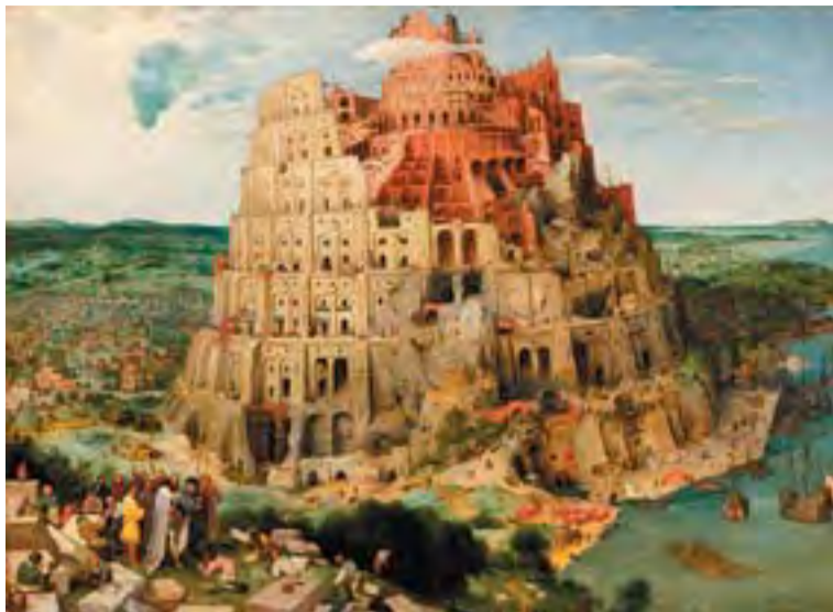
Bábel tornya Pieter Bruegel festményén

A nyelvtudomány eddig a pusztá véletlenül tulajdonította, hogy például a mama szó sok nyelven hasonlít: "m" betűt tartalmaz.