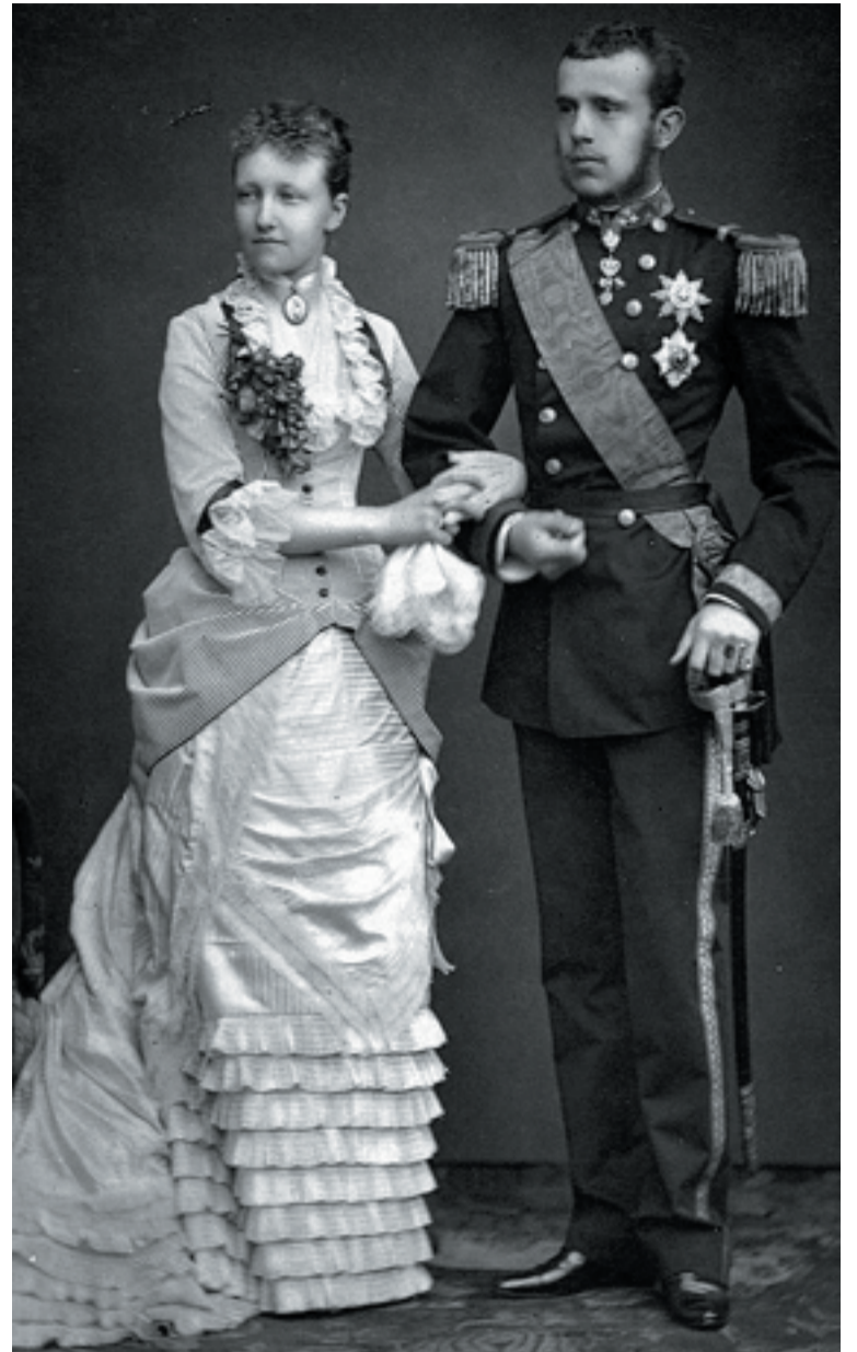
Stefánia Rudolf trónörökös oldalán

Vetsera Mária megmérgezte a trónörökösöt, de ebbe nem illett bele a Rudolf halántékán éktelenkedő hatalmas seb.