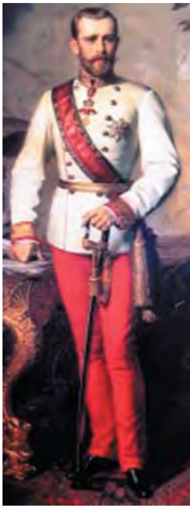
Rudolf főherceg, trónörökös

Közel 128 éve nem tudni, hogy valójában mi is történt azon a fagyos januári hajnalon a Bécsi-erdő öln megbúvó vadász kastélyban. Szerelmi öngyilkosság, részeg verekedés, vagy sötét háttérű politikai merénylet végzett-e az Osztrák-Magyar Monarchia trónjának várományosával, a bécsi udvar mohos konzervatívizmussal szembeszálló, bohém természetű, de ragyogó intellektusú Rudolf főherceggel? Számátlan teória született e tisztázatlan háttérű öngyilkosság vagy merénylet mélyebb okainak felfedezésére. Összeállításunkban a rejtélyes haláleset megválaszolatlan kérdéseit szedtük csokorba.