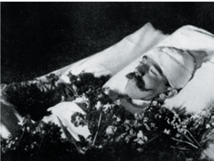
Rudolf herceg halálos ágyán

A fiatalberré váló Rudolf azután közelebb került édesanyjához. Rudolf klasszikus liberalizmusa anyja nézeteihez állt közel, mindketten szenvedtek a konzervatív Habsburg-udvar spanyolosan szoros etikettjétől, mozdulatlanságától, kapcsolatuk megjavult. Viszonya császári apjával viszont igen gyorsan megromlott. Rudolf sohasem titkolta kritikát véleményét Ófelsége osztrák vagy magyar kormányával szemben. Ez kiváltotta a Monarchia kormányköreinek bizalmatlanságát a trónörököszt szemben, akit emiatt teljesen elszigeteltek a politikacsináló folyamatoktól. Gyanús kapcsolatai miatt a császári titkosrendőrség is szinte állandó megfigyelés alatt tartotta Rudolfot. A konzervatív császár és liberális fia között áthidalhatatlan szemléletbeli különbség feszült. Ferenc József semmilyen jelét nem adta, hogy fiát be akarja vonni a kormányzásba. Egyrészt úgy érezte, még évtizedekig uralkodhat, másrészt úgy gondolta, Rudolfnak ki kell nőnie a liberalizmust, mint valami ifjúkori bolondságot, addig nem alkalmas az uralkodásra. Ferenc József tehát féltékenyen őrizte uralkodói hatalmát, és azt nem osztotta meg a trón örökösével sem. Az is tény, hogy ezt nemcsak a liberális Rudolfal szemben tette, hanem később, Rudolf halála után, az új trónörökösst, a konzervatív és imperialista gondolkodású Ferenc Ferdinánd főherceggel szemben is szilárdan megőrizte hatalma oszthatatlanságát.