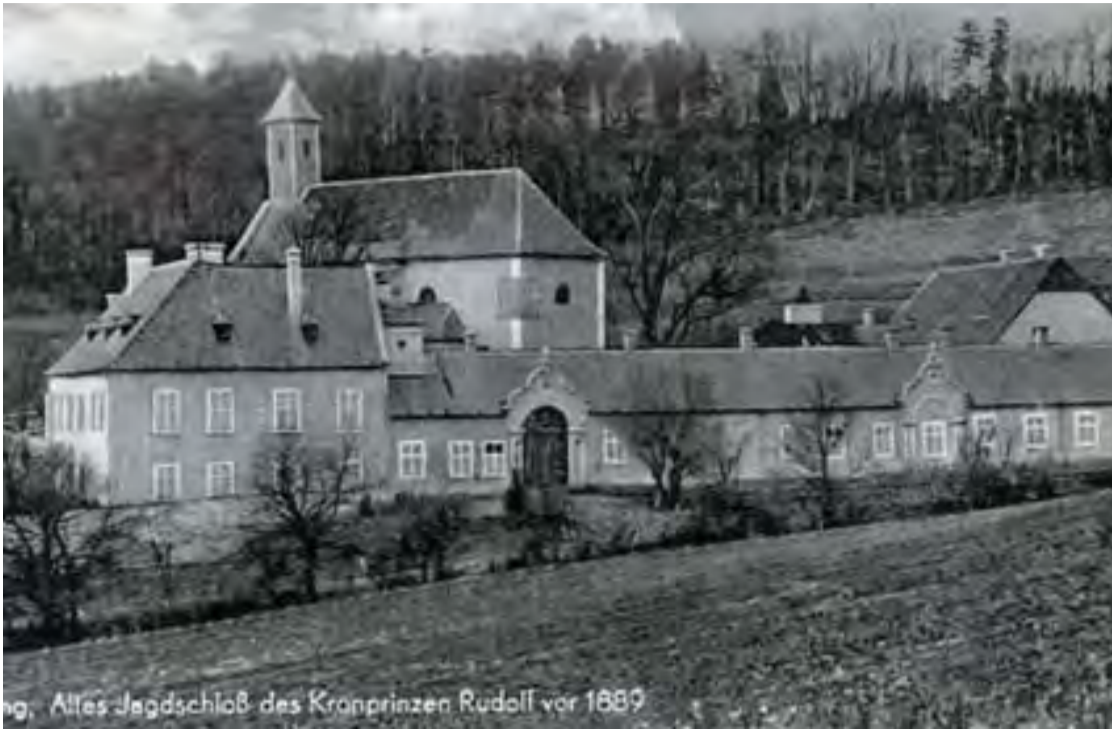
A mayerlingi vadászkastély 1889-ben. Később Ferenc József lebontatta az épületet

modern államjogi reformokkal, a külpolitikában pedig a francia-orosz szövetséggel, és a Monarchiára veszélyt jelentő német függőség feloldásával lehet biztosítani.