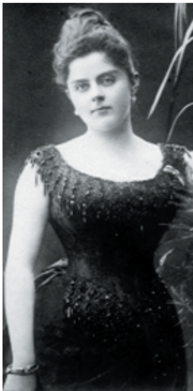
Mary von Vetsera bárónő fotója 1888-ból

1889 január 29-én, nem sokkal éjfél előtt a mayerlingi vadász kastély eme-