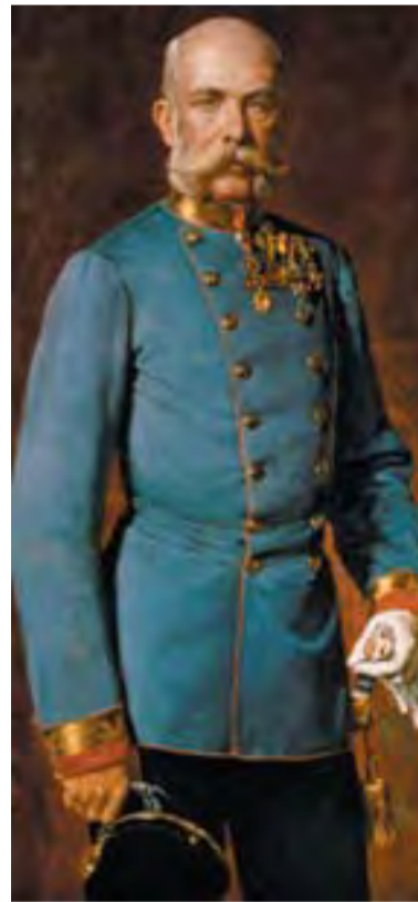
Ferenc József császárnak végig feszült volt a Rudolfval való kapcsolata

Az újratemetés előtt az azonosság megállapítása céljából a bécsi Igazságügyi Orvostani Intézet szakértői vizsgálták meg a csontvázat. Annak a szakértői kimondása mellett, hogy a csontok kétséget kizáróan néhai Vetsera Mária földi maradványai, tettek