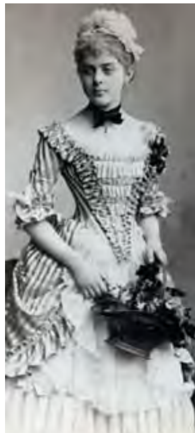
Vetsera Mária bárónő korabeli fotón

A gyászos hírt Hoyos gróf vitte Bécsbe. A Burgban a gróf először Erzsébet császárnénak jelentette be, hogy meghalt a trónörökös. Erzsébet a pár perces sokk után összeszedte magát, és átment Ferenc József lakosztályába. Mintegy félórát beszélt egymással a császári pár, de hogy miről volt szó köztük, mai napig nem lehet tudni. Már a kortársaknak is feltűnt, hogy Ferenc József milyen „higgadt rezignáltsággal” fogadta fia halálhírét. Először az terjedt el az udvarban, hogy az úgymond „alsóbb körökből” származó