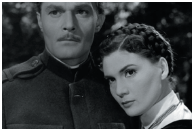
Darvas Iván és Bara Margit a Bakaruhában című, 1957-es filmben, amelyet Fehér Imre rendezett és Badal János fényképezett

sott a színpadról — mondta korábban Bara Margitról Törőcsik Mari.