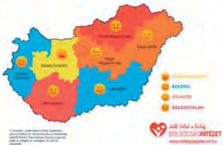
Magyarország Boldogságtérképe régiós bontásban