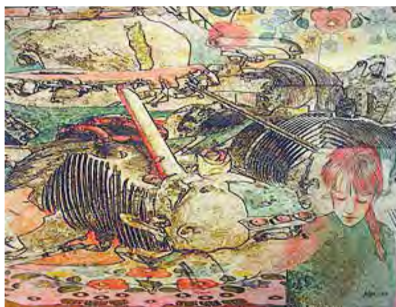
Molnár Éva The aftermath

A kiállítás szeptember 30-ig megtekinthető hétköznap 10–4-ig.