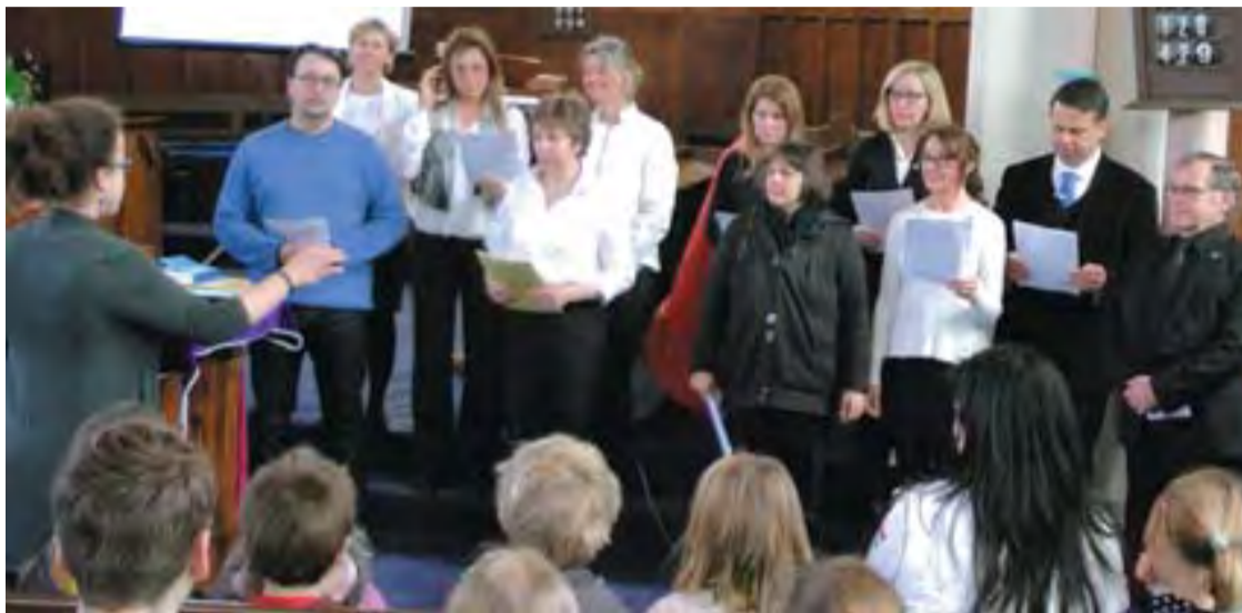
Az egyházi kórus első fellépése