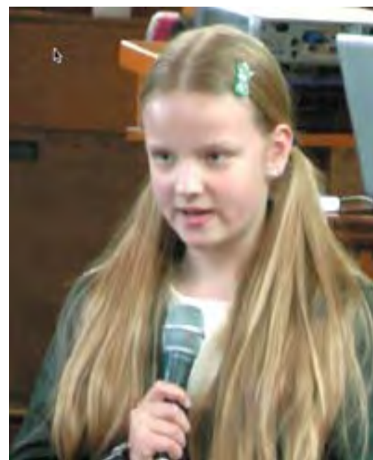
Vasárnapi iskolások felolvassnak egy-egy imát