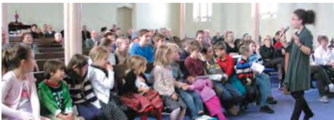
Vasárnapi iskolások az Istentiszteleten