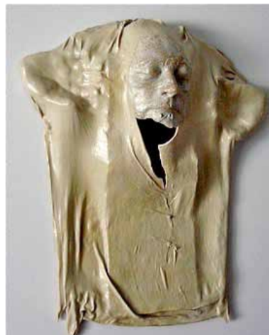
Paulini József munkája

– Az emberek nem mertek beszélni, besúgók ezrei, titkos rendőrség (AVH), lefüggönyözött fekete autók cikáztak éjjelente a várost és tűntek el emberek, (sok esetben örökre). Ahogy