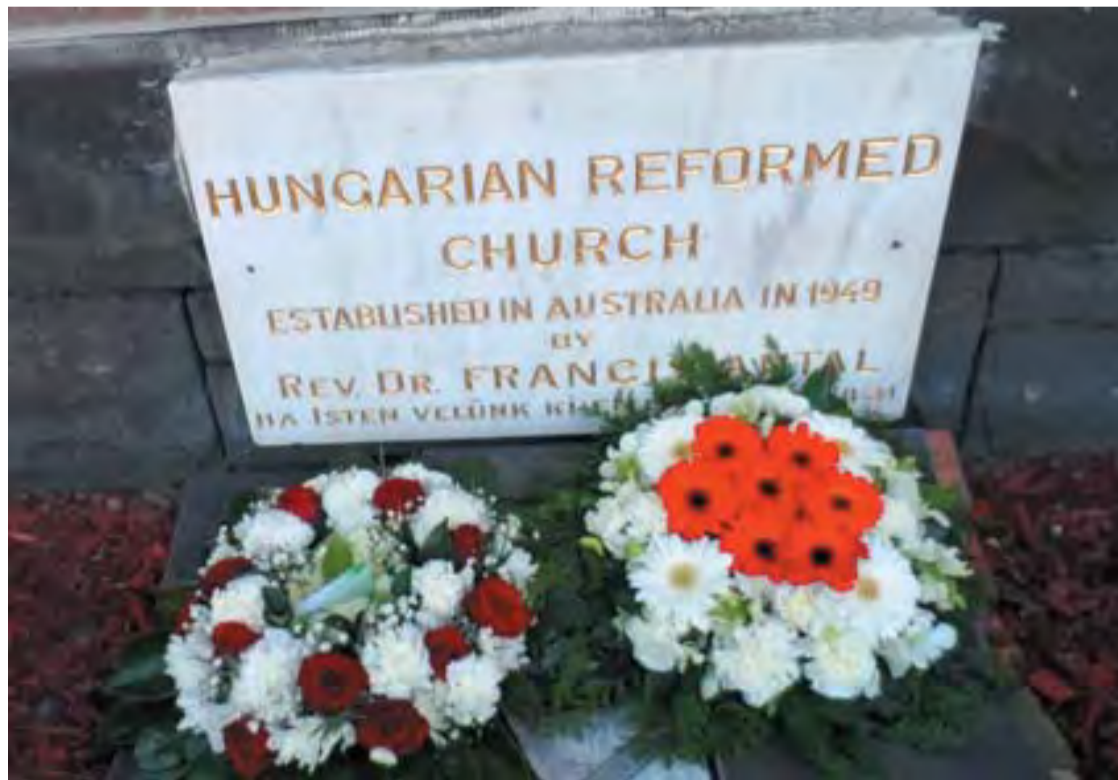
Az alapító lelkész Emléktáblája