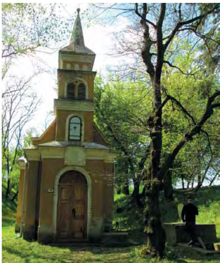
A kegykápolna és a Szentkút