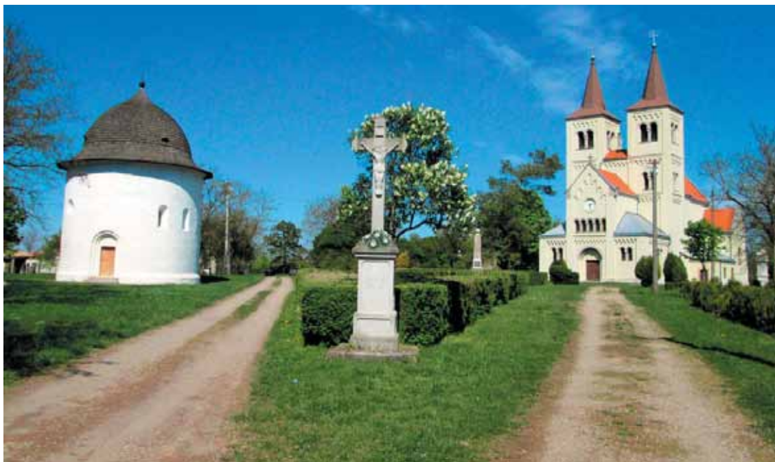
A Körtemplom és a Szűz Mária tiszteletére szentelt apátsági templom

tuk, évi háromszor szentmisét is tartanak itt, magyar nyelven (pünkösdhétfőn, Szűz Mária mennybevétele napján, Szűz Mária születésének ünnepén). Ha szemben állunk vele, akkor a bájos kivitelű kápolna jobbán egy már régóta nem működő kutat talá- lunk, amit az itt élők Szentkútként emlegetnek. A legenda szerint Szent László király úgy és azzal mentette meg katonáit a szomjazástól, hogy kardját a földbe szúrta és erre tiszta víz fakadt. A kápolna másik oldalán pedig egy valóban ősinek mondható magyar emlék, egy földvár eredetileg háromsoros védelemként szolgáló sáncainak kevéske, de azért így is méretes maradványai. Keletkezéséről az idők során több teória megfogalmazódott, melyek közül a régészek a legvalószínűbbnek azt tartják, hogy valamikor a 10. században épült, Géza fejedelem emeltethette. Ahogyan a verőfényes napsütésben ott sétálgatunk a maradványok tövében, előbb még csak szájatva szemléltünk mindent, de aztán, 21. századi fejjel gon-