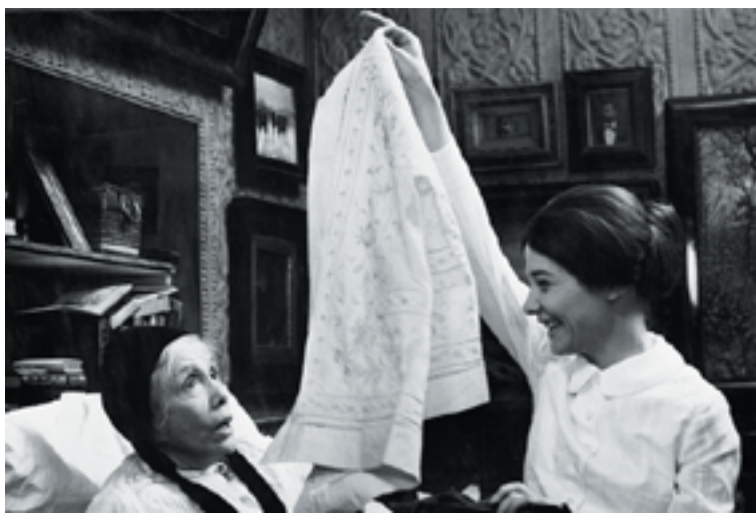
Darvas Lili és Törőcsik Mari a Szerelmek című filmben

Május 11-én Ferenc névnapja van. Kibővített naptárak szerint Fábó, Fábúsz, Fabrició, Fabricius, Fabriciusz, Filip, Fülöp, Gujdó, Izidor, Izidóra, Izor, Jakab, Jákó, Jákob, Jakus, Kalliszta, Majlát, Mályva, Mirandella, Mirandola névnapja van.