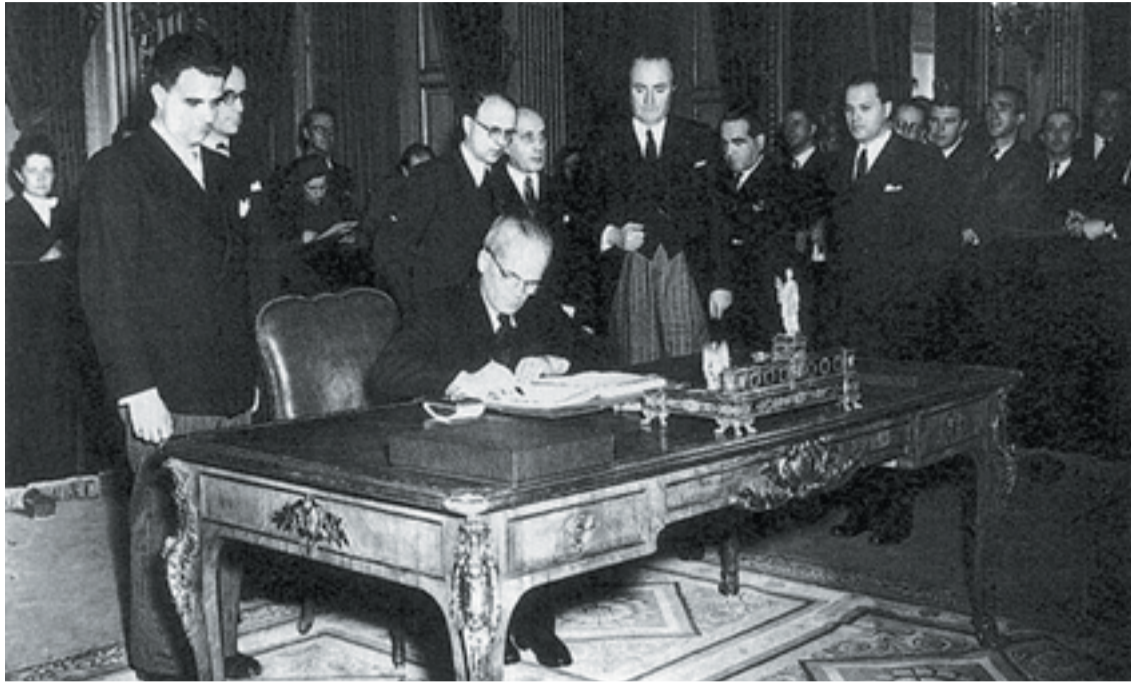
Gyöngyösi János külügyminiszter 1947. február 10-én aláírja a Trianont megerősítő párizsi békeszerződést

emellett jóvátétel gyanánt hatalmas élelmiszer-szállítmányok indultak a Szovjetunióba. A megszállók kezébe került a magyar ipar színe-java, az összes korábbi német és osztrák tulajdon. Még Nyugaton volt a magyar nemzeti vagyon jelentős része, mozdonyok, hajók, üzemek felszerelése, a Nemzeti Bank teljes aranykészlete. Jugoszlávia és Csehszlovákia is követelte a jóvátételt. Fenyegetően közeledett a magyar-csehszlovák lakosságcsere-egyezmény végrehajtása. Újabb tízezrek keltek útra a bizonytalan jövő minden félelmével.