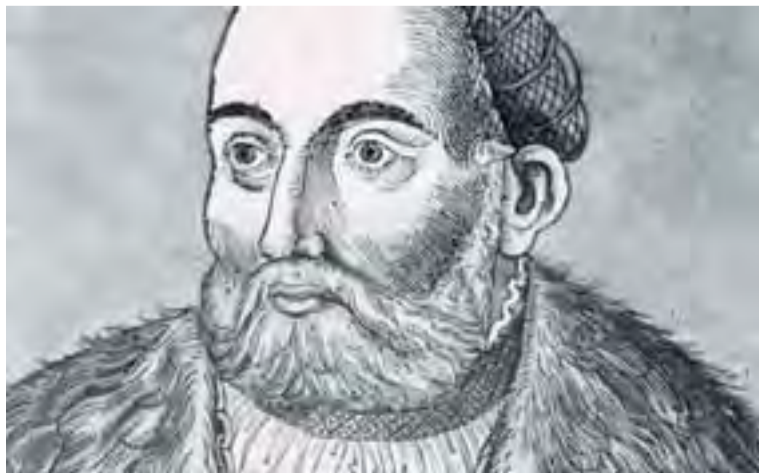
I. János magyar király arcképe. Erhard Schön (1491–1542) fametszete

Több információért vagy helyszin túsáért, kérem forduljon Simo Évához a (03) 8720 1300 telefonszámon www.ttha.org.au