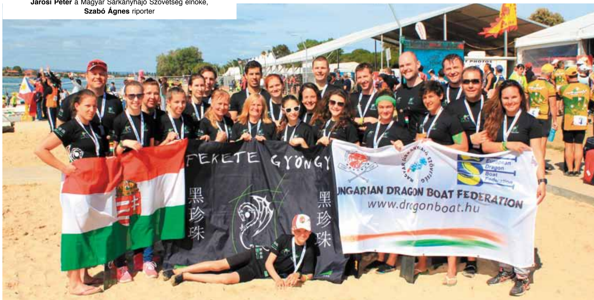
Fekete Gyöngy Sárkányhajó Szövetség legénysége Adelaideben