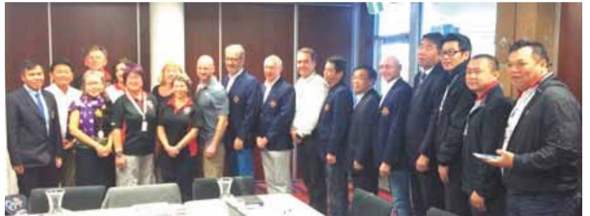
IDBF Vezető Testület

Az eddig leírtakból is kiderül, hogy a sárkányhajózás egy olyan közösség teremtő és fejlesztő sport, amelyben egyszerre, egy célért több mint 20-an küzdenek. Egy legénység 2 labdarugó csapatnyi emberből áll. A sárkányhajózást Magyarországon a Magyar