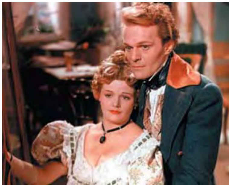
Krencsey Marianne és Darvas Iván a Liliomfi című filmben