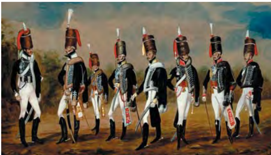
Huszárok a 18. század végén

A bukovinai székely települések közül Andrásfalva és Hadikfalva is a hős magyar tábornok emléket őrzik. Az egyik leghíresebb magyar huszár bronz lovas szobra a budai várban látható. Hadik András gróf, birodalmi tábornagy, a 18. század nemzetközi híru hadvezére 80 éves korában, 1790. március 12-én hunyt el.