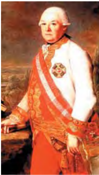
Gróf Hadik András tábornagy korabeli portréja

A hadtörténelem leghíresebb huszár-csínyje Hadik András gróf nevéhez fűződik. A vakmerő portyáiról elhíresült magyar stratégának, a Habsburg Birodalom legmegbecsültebb tábornokának Berlin megsarcolása volt a legismertebb haditette. Az egyik leghíresebb magyar hadvezér, Hadik András gróf 226 éve, 1790. március 12-én hunyt el.