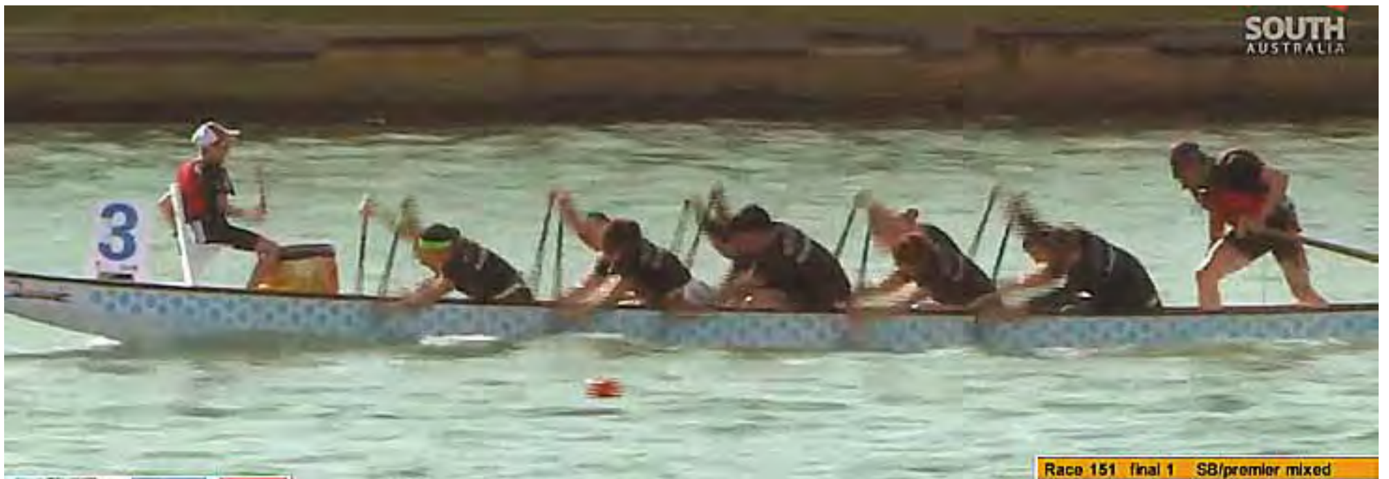
Race 151 final 1 SB/premier mixed

Célunk, hogy Magyarországon létrejöhessen a társadalom minden rétegét átfogó (diákok, aktív dolgozó emberek, sportolók) szabadidős tevékenységként, vagy akár sportágként is ezt választó emberek közössége. A fenti célok megvalósításáért, a sportág érdekében tett minden erőfeszítést és kezdeményezést, eddig is és a jövőben is támogatunk, támogatni fogunk!