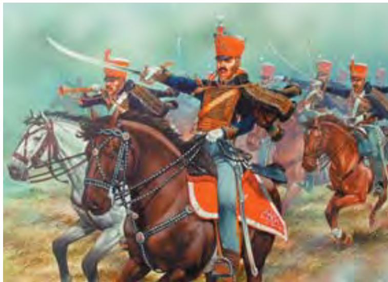
Hadik András alig több mint 4000 lovassal indult el a kalandos portyára