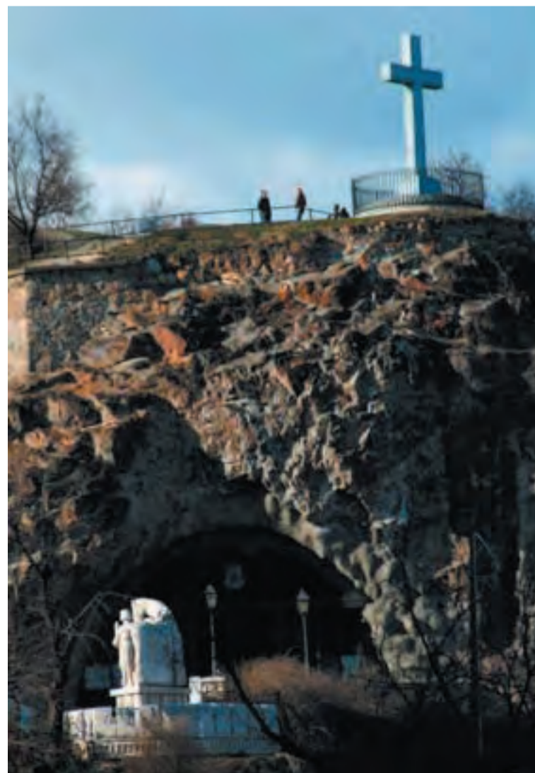
A Gellért-hegyen lévő pálos sziklakápolna