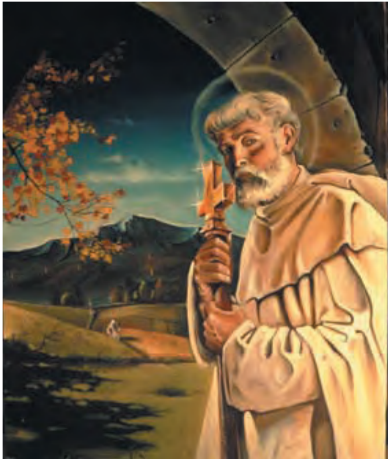
Boldog Özséb, a rendalapító portréja

egyetlen olyan intézmény, amely birtokai miatt évszázadokon át szoros kapcsolatban állt ezzel a fontos gazdasági ágazattal, amely az emberi megélhetés alapvetően fontos termékeit állította elő.