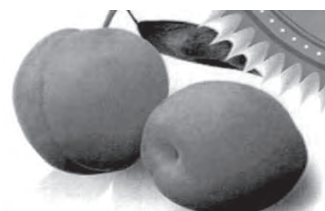
$200 egy rekesz