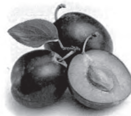
$200 egy rekesz