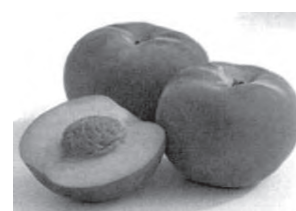
$200 egy rekesz