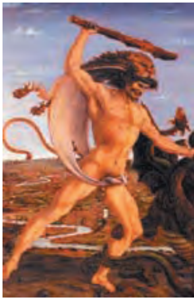
Theagenészről azt állították, hogy Héraklész fia

Nagyon régi időkre — konkrétan az ősi görögökhöz — nyúlik vissza az a gyakorlat, amikor úgy vélték az élettelen dolgok is törvény előtti felelősséggel tartoznak az általuk okozott