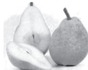
$150 egy rekesz