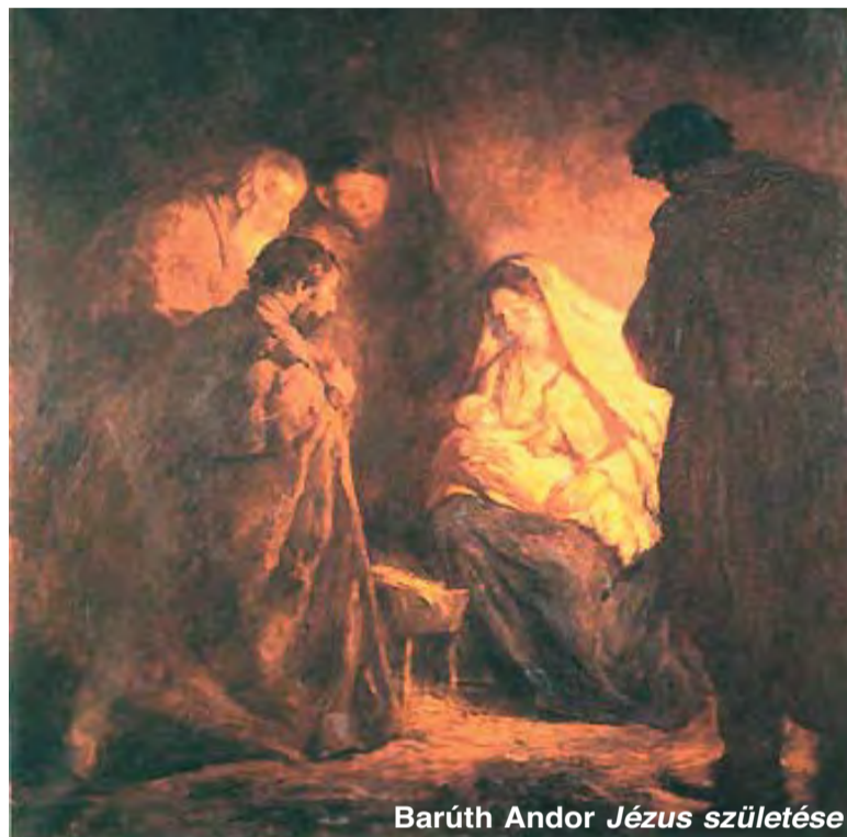
Barúth Andor Jézus születése

Az alapgondolatként felolvasott bibliai vers János evangéliumának első soraiból való. Egy himnusz-szerű szövegben hangzik el, amely Jézus világrajöttét és színrelépését ünnepli. Mondhatjuk úgy is, hogy ezek a sorok a János evangélista szerinti születéstörténetet mondják el. Ebben a Prológusnak nevezett, evangéliumot bevezető szövegben nem olvasunk sem