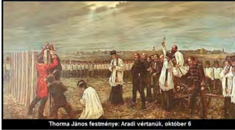
Thorma János festménye: Aradi vértanúk, október 6

régen kiérdemelte már a jogot arra, hogy végre önmagát kormányozza. Harcukat törvényesnek tartották, hiszen 1848 tavaszán az osztrák császári udvar is elismerte a magyarországi reformok szükségességét. Az Udvar meghátrálása azonban csak 1848 nyaráig tartott. Miután az európai uralkodók sorra, mindenütt levertek a forradalmakat, Bécs a magyarok ellen fordult. A szabadságharc kitört és sok ezer bátor magyar katona és tiszt véráldozatát követelte.