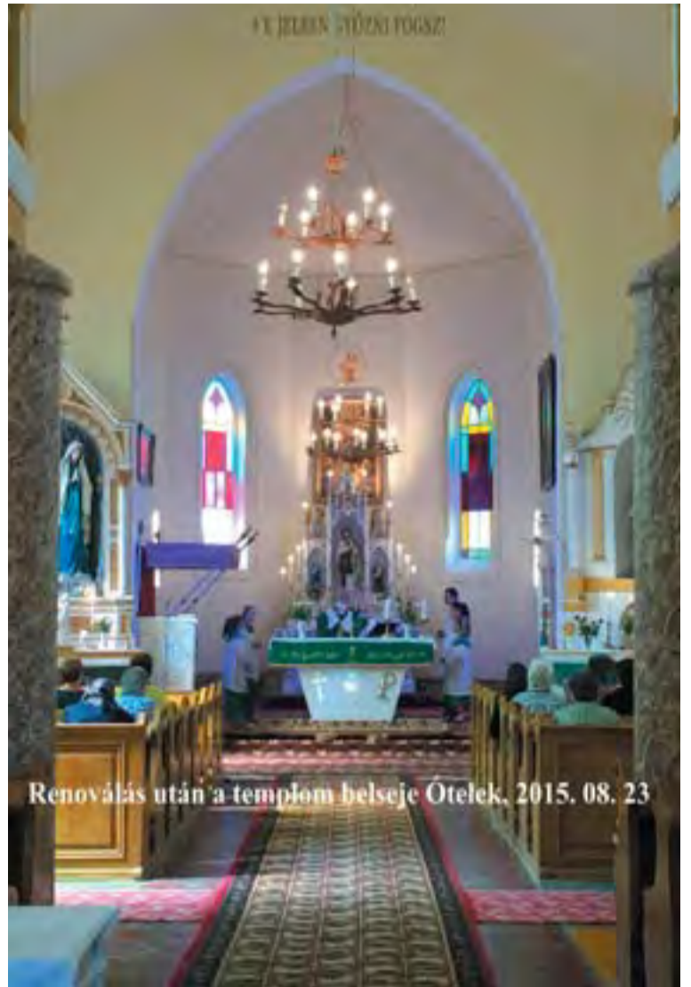
Renoválás után a templom belseje Ótelek, 2015. 08. 23

Köszönjük a lelkesedést, szolidaritást és áldozat-készséget, külön szeretnénk megköszönni azoknak is, akik más államokból küldenek rendszeresen tá-