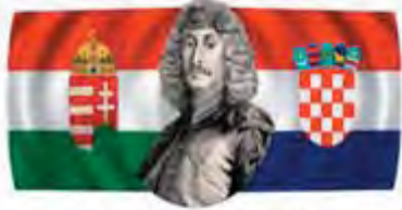
MAGYAR-HORVÁT BARÁTI KÖR