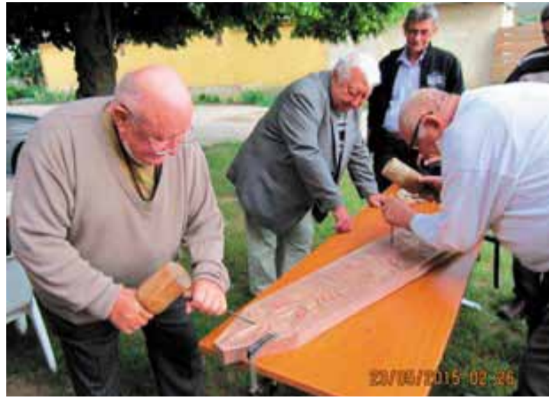
Munkában a fafaragók a Böszörményi László Faluháznál

A magyar vidék megmaradásának és fejlődésének lehetőségeire, esélyeire kívánta felhívni a figyelmet ez