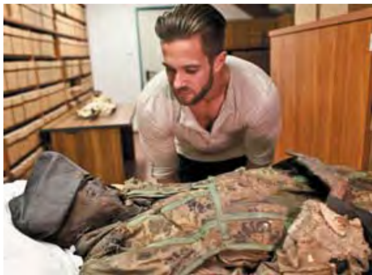
Széchényi Kristóf, a család egyik legfiatalabb tagja tiszteletét teszi rokona, Széchényi Pál érsek múmiájánál

szerint csak az országgyűlés jogosult az adótörvények meghozatalára.