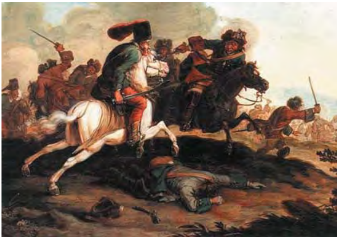
Georg Philipp Rugendas festménye a kuruc-labanc lovaspárbajról

A Rákóczi szabadságharcig szinte egyáltalán nem szerepelt a közéletben, és nem is tartott igényt rá — amikor azonban a felkelés kitört, hazafiként kötelességének érezte, hogy tegyen valamit az országért. A magyar ügyek védőjeként vonult be a köztudatba, I. Lipótnak ki is fejtette, hogy véleménye