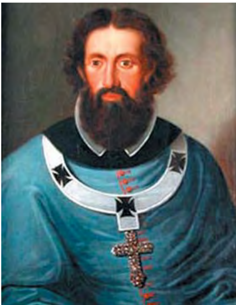
Széchényi Pál érsek portréja