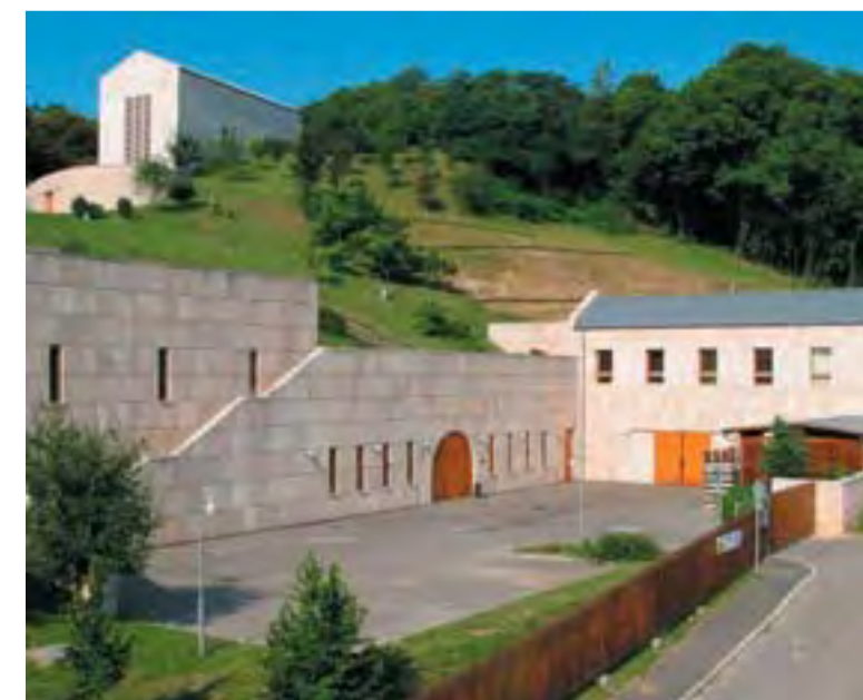
Pannonhalmi Apátsági Pincészet