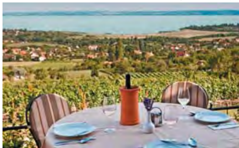
Látkép a csopaki dombról

Még ennél is izgalmasabb a terasz az egri borokkal és kávéval, panorámával a Nagy-Eged-hegyre, az Almagyar-, a Síkhegy- és a Pajdos-dűlőkre, a Bükk és a Mátra vonulataira. A faházak mellett és a medence partján napokat el lehet tölteni a szőlőtőkék között. Ha valaki aktív kikapcsolódásra vágyik,