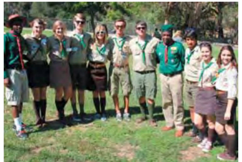
41. Nemzetközi Cserkésznapi Los Angelesben – együttlét és összetartás –