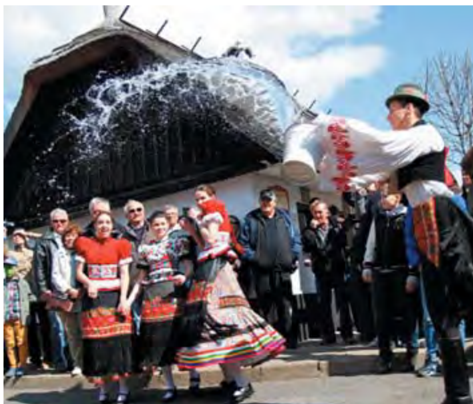
Mezőkövesden a matyó fiúk locsoltak