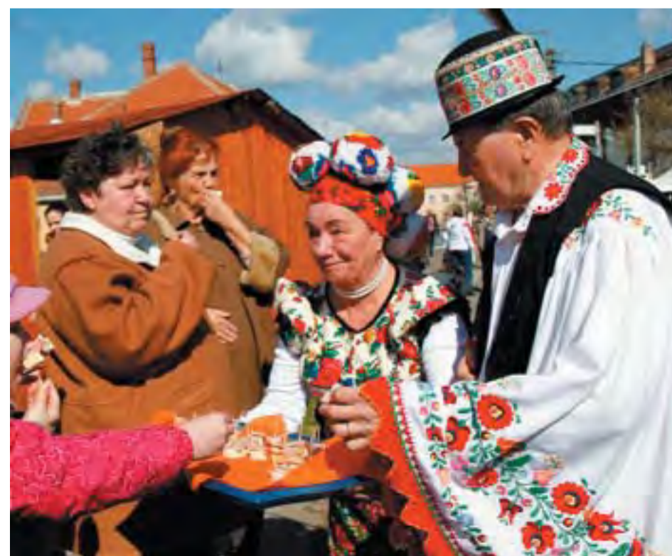
Az étel is előkerült