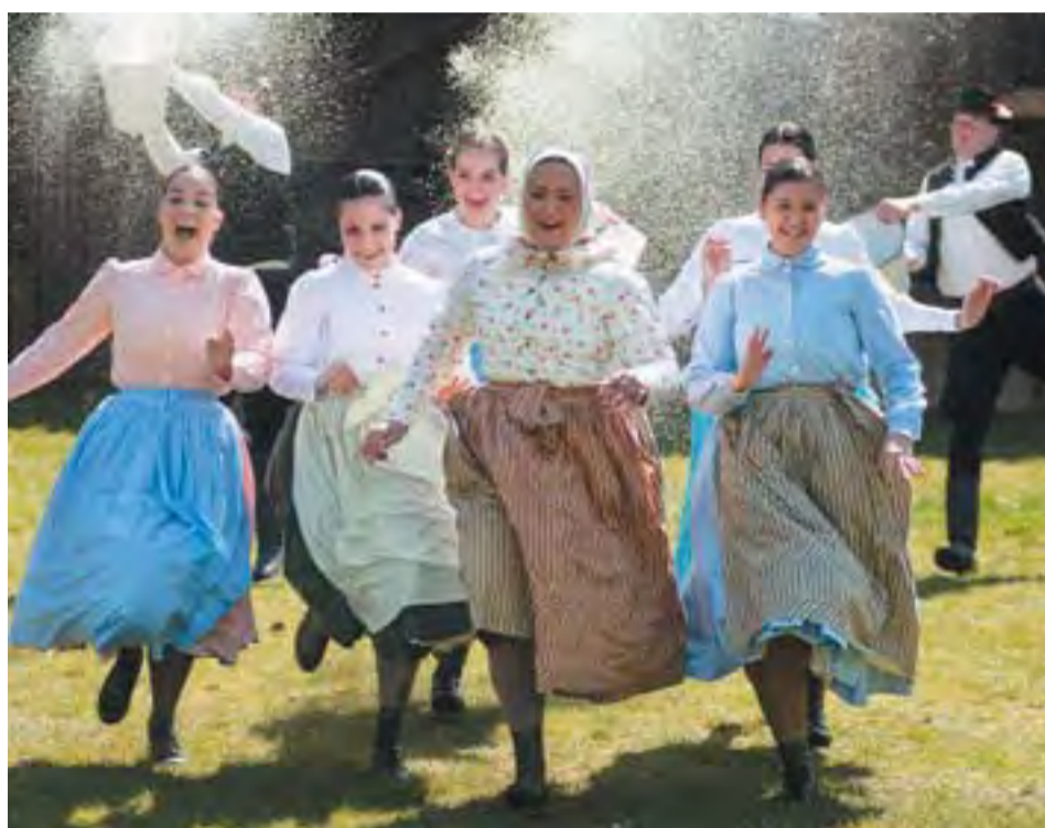
Nyíregyházán sem úszták meg a lányok