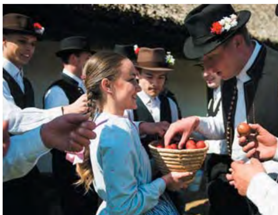
A Sóstói Múzeumfaluban volt a mulatság, és aki locsolt, megkapta a piros tojást.