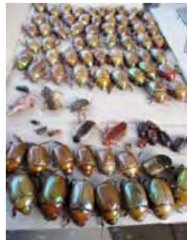
A zsákmány egy része

él erre felé. A tojást tojój, de kicsinyét mégis szoptató monotremák családjába tartozik ez a rendhagyó állat, melynek legközelebbi – és egyben egyetlen – rokona az erszényes sün. Kinézet szempontjából két különböző állatot szinte el sem lehetne képzelni, mert míg a kacsacsőrű, vízi állat lévén, síma szőrű, mondhatni „áramvonalas” küllemű, addig az erszényes sün kizárólag egy szárazföldi éllethez ikdomult, lomha mozgású, tüskés gombóc. S mégis, mindketten tojás formájában hozzák világra ivadékaikat és tejükön nevelik fel őket.