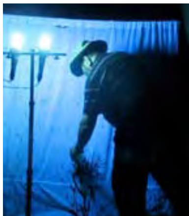
UV sátras gyűjtés

Ideje visszafordulnunk, irány Sydney ismét. Szaladnak az órák és napok, fogynak a km-ek. 6500 km, négy hét utazás és egy rövid sydneyi pihenő után csapatunk a repülőtéren találja magát. Búcsúznak, s reméljük, hogy expedíciójuk eredménye, a több mint 10 000 preparált rovar hasznosnak bizonyul majd a magyar tudomány számára. Az, hogy pompás élményeket is mondhatunk magunkénak, az csak egy kis bónusz.