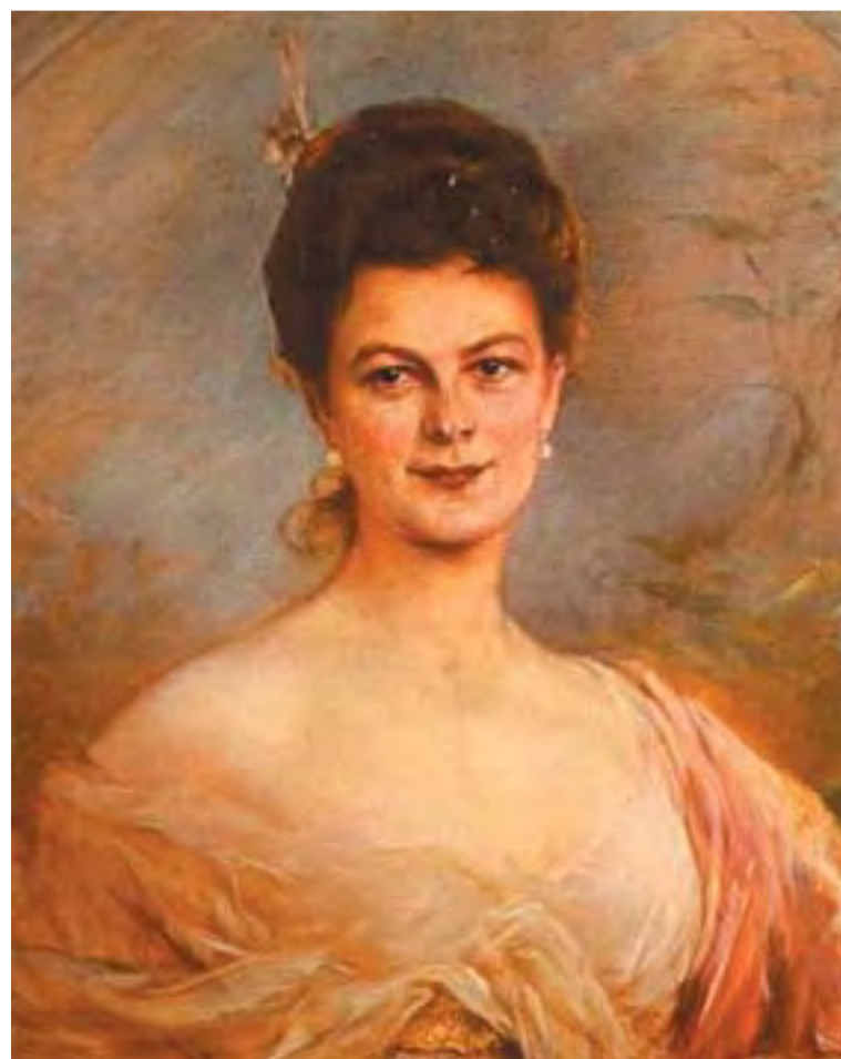
Chotek Zsófia grófnő portréja. Ferenc József sohasem bocsátotta meg unokaöccsének a grófnővel megkötött morganatikus házasságát

Bécsben és Budapesten sem kedvelték Ferenc Ferdinánd (1863 – 1914) I. Ferenc József császár öccse, Károly