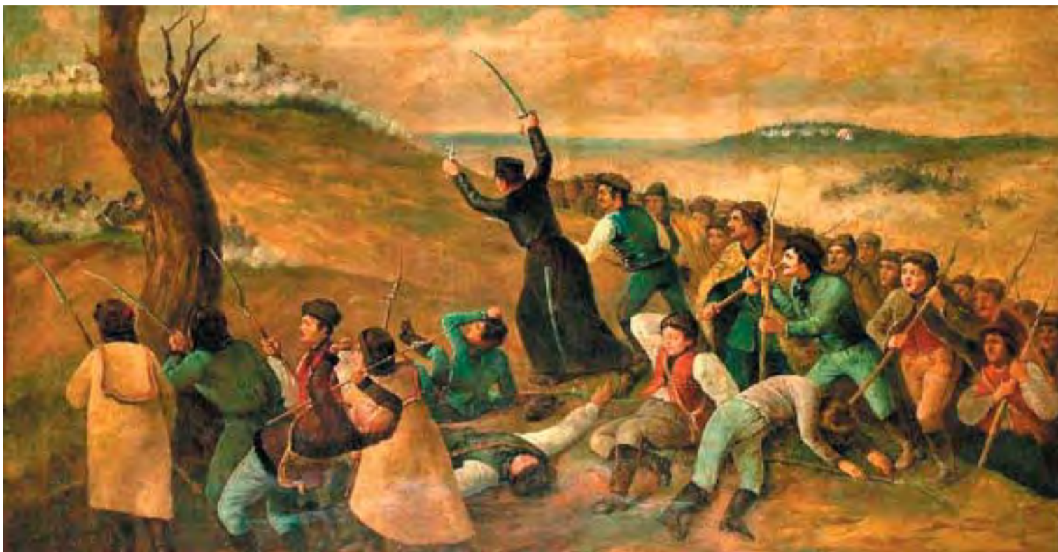
Stech Alajos: Erdősi Imre a branyiszkió ütközetben (1880 körül)

A Piarista Rend Magyar Tartományának provinciális, Labancz Zsolt hangsúlyozta: az iskolának ma is arra van szüksége, hogy meg tudja álmódni azt, hogy az előirtakon túl mire van szüksége a gyerekeknek. A látogatóknak azt kívánta, hogy a kiállítást megtekintve kerüljenek kapcsolatba azzal a lelkiülettel, amely a piaristákat jellemezte a tanítás során.