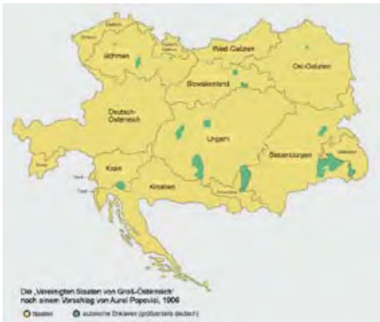
A Popovici-féle 1906-os föderális államszerkezet közigazgatási térképe

A reformintézkedések első lépéseként a birodalom kebelén belül létrehozták volna a későbbi Jugoszlávia előfutárát, a Horvátország, Bosznia-Hercegovina, valamint Dalmácia alkotta Délszláv Királyságot. A délszláv társállam ugyanolyan jogállással rendelkezett volna, mint a Magyar Királyság az 1867-es kiegyezés után. Második lépésben a Monarchiát Aurel Popovici 1906-os javaslatának megfelelően föderális államszövetséggé alakították volna át, Nagy-Ausztriai Egyesült Ál-