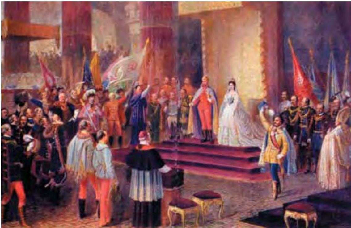
Ferenc József magyar királlyá koronázása Budán. Az 1867-es kiegyezés alkotta a dualista rendszer államjogi alapjait

II. Ferencként kívánt uralkodni, és előre elkészítette azt az átfogó államjogi reformtervet, amely a Monarchiát dualista monarchikus államszövetség-