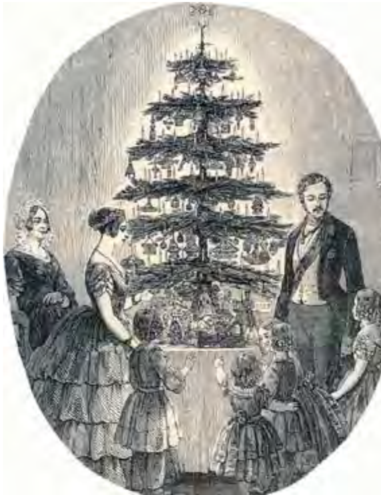
1848 decemberében jelent meg a The London Illustrated News -ban

metalföldi család ünnepi szokásait. Fenyő persze még nincs a képen, hisz Szent Miklós napján járunk, de a mozgalmas kompozíció jól visszaadja azt a pezsgő, karneváli hangulatot, mely a téli napforduló körüli ünnepeket jellemezte ekkoriban.