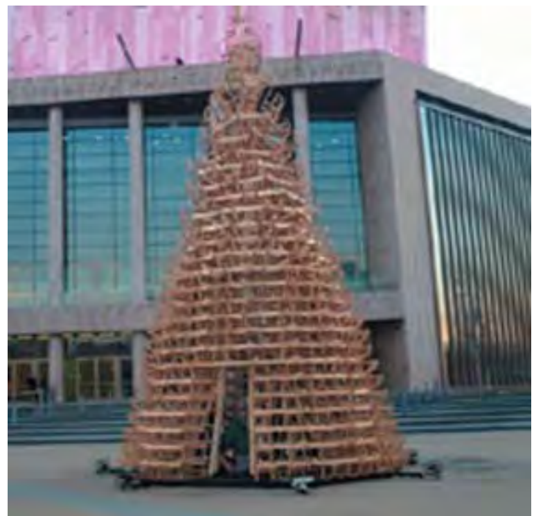
Hello Wood, Telekom karácsonyfa szánkóból

2012-ben még a tévéképernyőkből összerakott brüsszeli fenyő borzolta a kedélyeket, melyet sokan a karácsony megtagadásaként értékelték. Idén viszont már Párizsban okozott hatalmas botrányt az a felfújható karácsonyfa, mely zavaróan emlékeztetett egy szexuális játékszerre. A franciák nem voltak elragadtatva ettől az asszociációtól. A feldühödött ellenzők végül az éj leple alatt megrongálták a műalkotást, sőt, még egy kiadós pofont is lekevertek az amerikai művésznek.