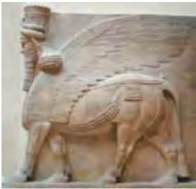
Az Asszír Birodalom jelképe

A kutatókat régóta foglalkoztatja ez a probléma — most kiderült, hogy klímaváltozás és hirtelen népességnövekedés állhat a Birodalom összeomlásának hátterében.