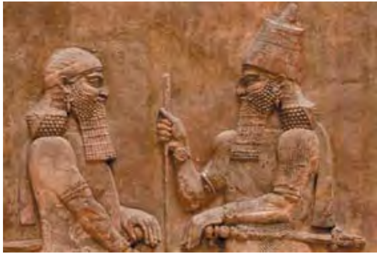
II. Szárgon asszír király (jobbra) egy előkelő társaságában. Ninivéből az Asszír Birodalom fővárosából származó dombormű

nél is több problémával kellett megküzdeniük.