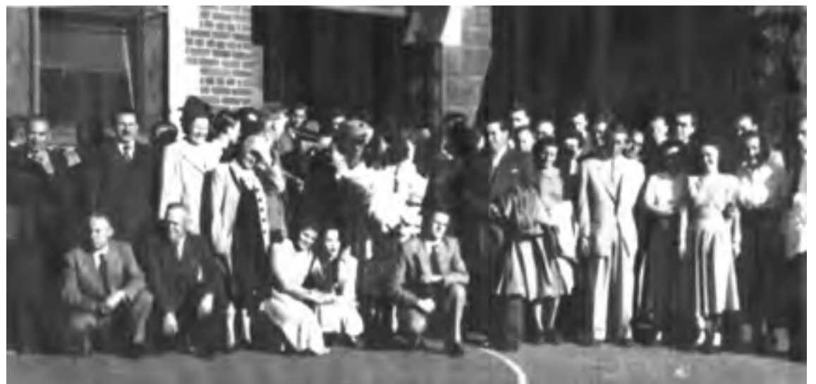
Az 1956-os Forradalom után, gyülekezeti kép a Napier Street-i Presbyterian Church udvarán. Az alapító lelkész a hátsó sor jobboldalán a második személy.