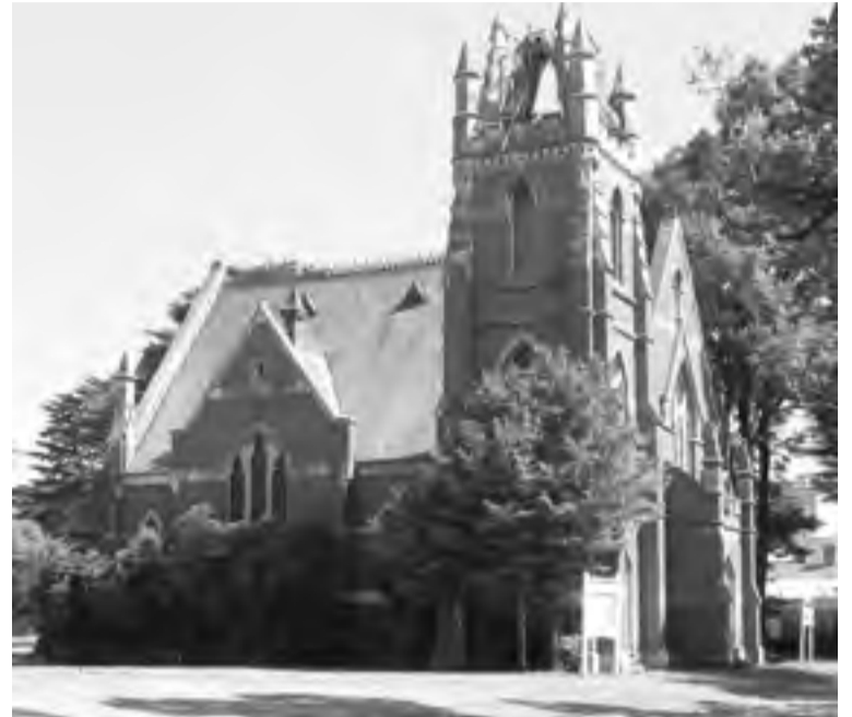
1949-50 évi Istentiszteletek otthona a Parkville-i Presbyterian Churchben