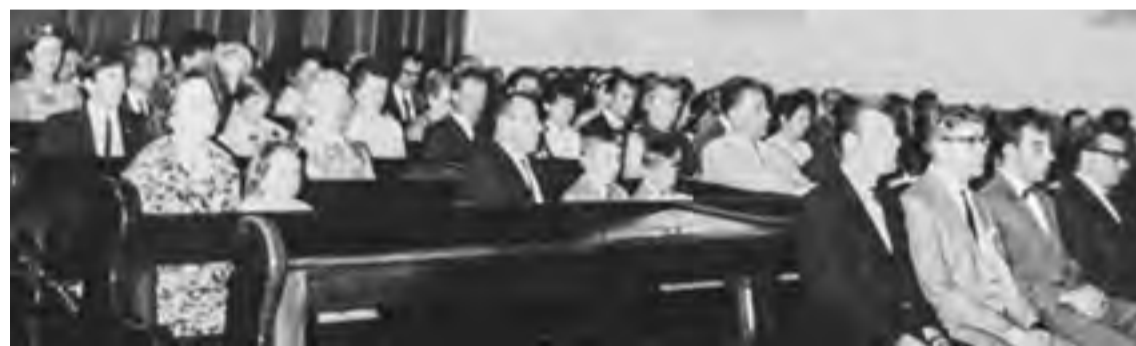
Napier Street-i gyülekezet 1966