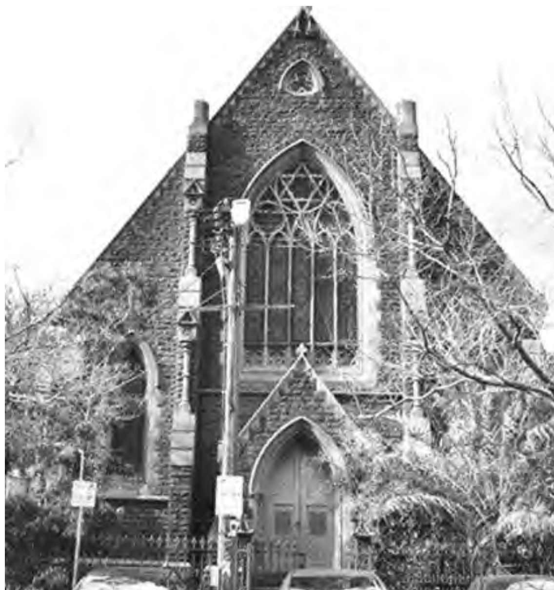
Napier Street-i templom, ahol minden vasárnap délután 3 órákor lett megtartva az Istentisztelet. Ige hirdetés után a gyülekezet felment az első emeletre a templomi nagyterembe, ahol összegyűltek társalogni, kávézni, lemezekre táncolni, saakozni és a közösséget építeni.

Telefon: (03) 9439-8300 Email: csutoros@tpg.com.au