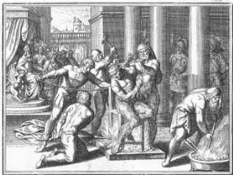
Dózsa György kivégzése. Mattheus Merian rézmetszete